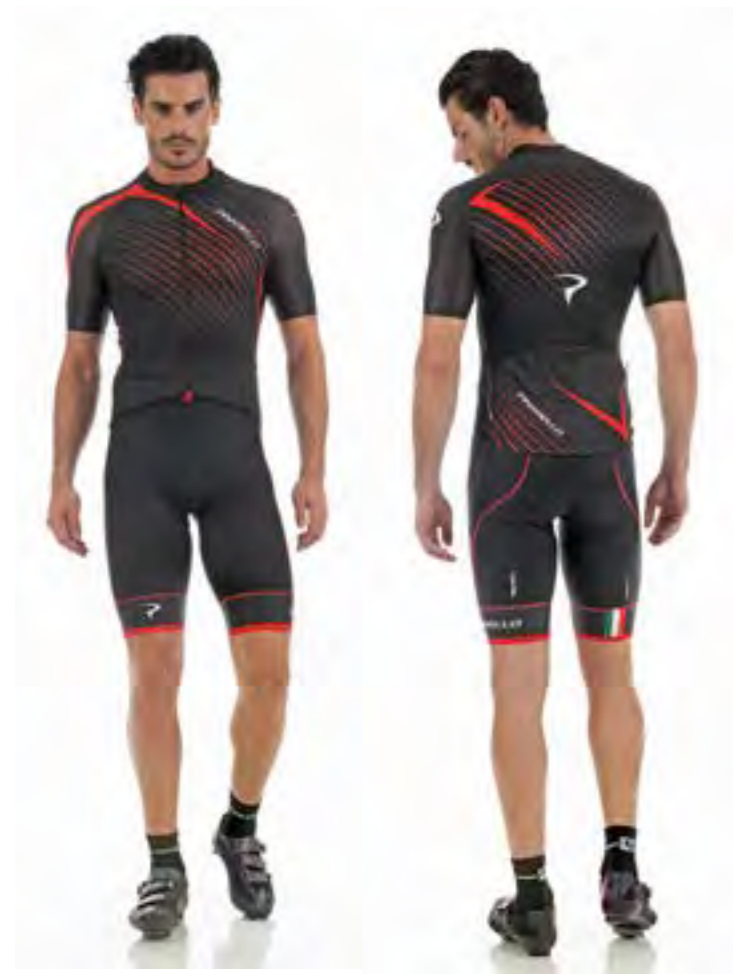
MAILLOT NEGRO - ROJO 112.20€ Tallas: S-M-L-XL