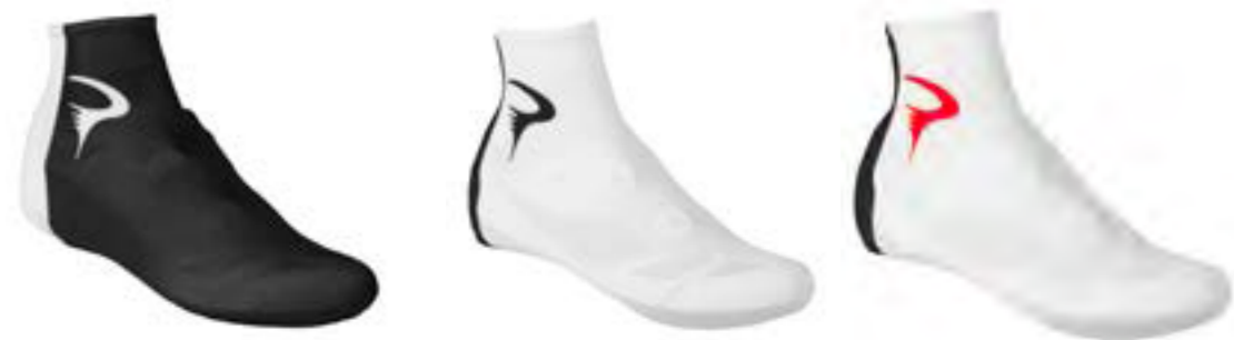
PAR DE BOTINES LYCRA PINARELLO NEGRO/BLANCO, BLANCO/NEGRO, BLANCO/ROJO.