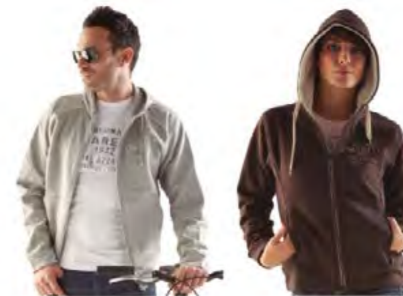
CHAQUETA PINARELLO C/CAPUCHA HOMBRE Azul, Gris (Tallas M-L) 103.25€ CHAQUETA PINARELLO C/CAPUCHA MUJER Marrón (Tallas M-L) 103.25€