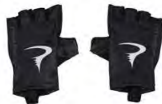
PAR DE GUANTES PINARELLO