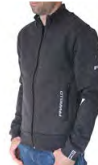
CHAQUETA FIO HOMBRE Gris - Negro