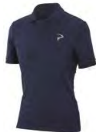
POLO PINARELLO HOMBRE Azul