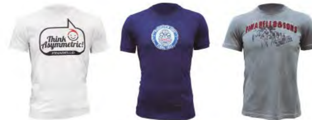
CAMISETA THINK ASYMETRIC Blanco (Tallas S-M-L-XL) 22,15€ CAMISETA CROCK ASYMETRIC Azul (Tallas S-M-L-XL) 34,40€ CAMISETA SONS ASYMETRIC Gris (Tallas S-M-L-XL) 44,25€