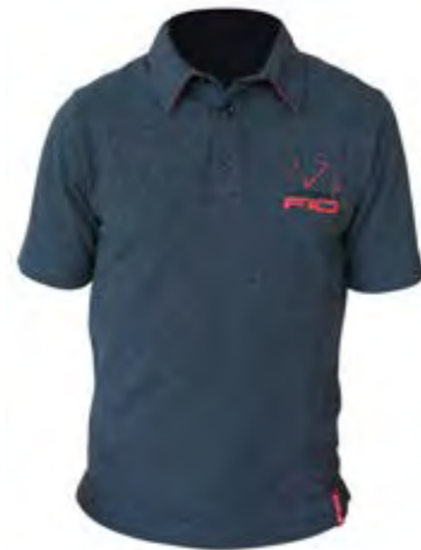
POLO FIO HOMBRE Azul