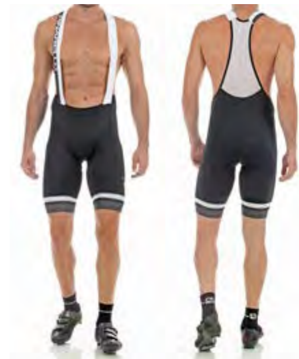
CULOTE NEGRO - GRIS 94,40€ Tallas: S-M-L-XL

La Colección CORSA está diseñada con distintos elementos y con un ajuste perfecto.