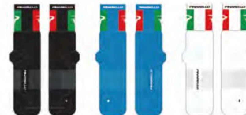
PAR DE CALCETINES MEDIO PINARELLO NEGRO/ITALIA, AZUL-SKY/ITALIA, BLANCO/ITALIA

Tallas: S (37-40) - M (41-44) - L (45-46)