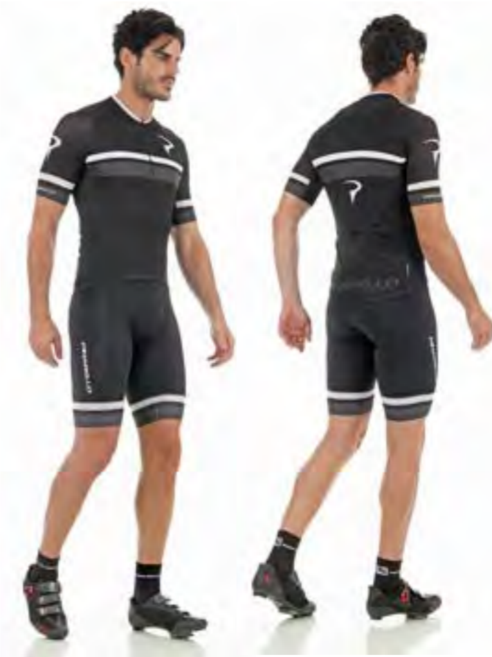
MAILLOT NEGRO - GRIS 94,40€ Tallas: S-M-L-XL