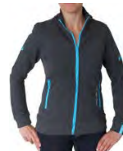
CHAQUETA LIGERA FIO MUJER Gris - Sky