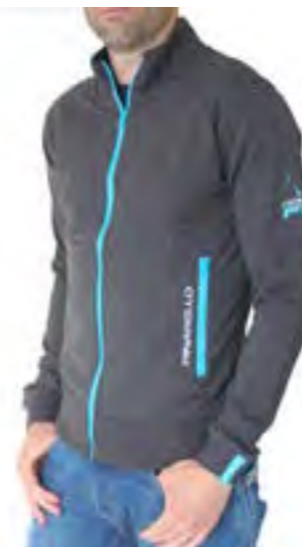
CHAQUETA LIGERA FIO HOMBRE Gris - Sky