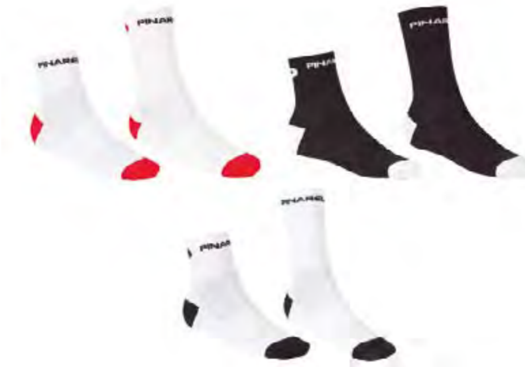
PAR DE CALCETINES MEDIO PINARELLO BLANCO/ROJO, NEGRO/BLANCO, BLANCO/NEGRO