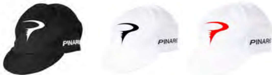
GORRA ALGODÓN PINARELLO NEGRO/BLANCO, BLANCO/NEGRO, BLANCO/ROJO.

Tallas: S (37-40) - M (41-44) - L (45-46)