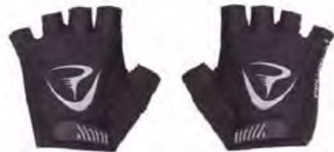
PAR DE GUANTES Verano CORSA

Tallas: S (37-38) - M (39-41) - L (42-44) - XL (45-46)