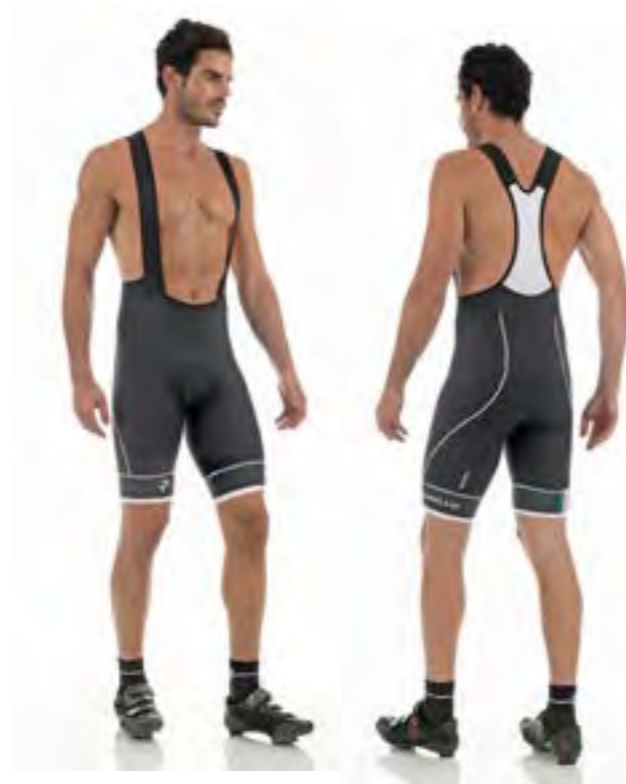
CULOTE NEGRO - BLANCO 120.40€ Tallas: S-M-L-XL-XXL