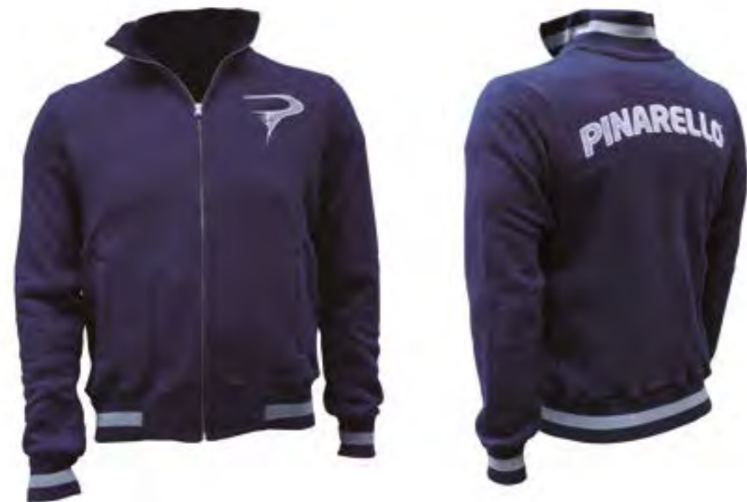
CHAQUETA PINARELLO HOMBRE Azul