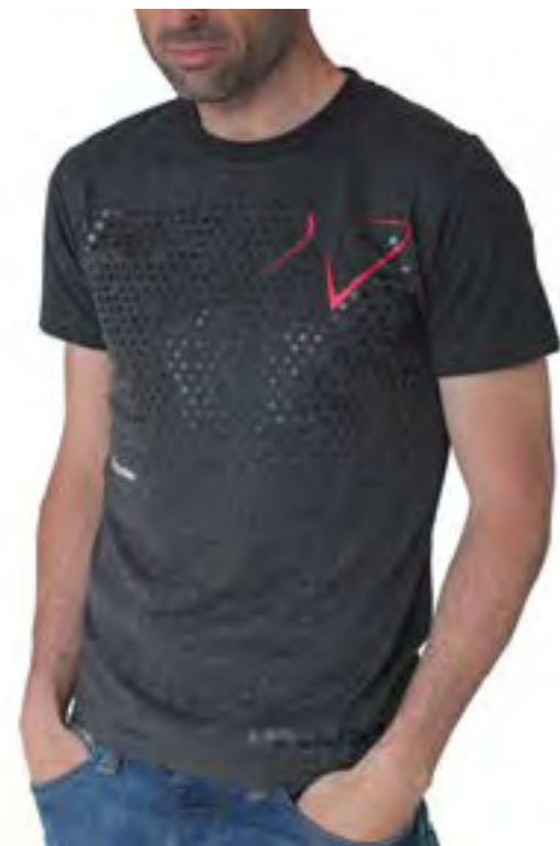
CAMISETA FIO HOMBRE