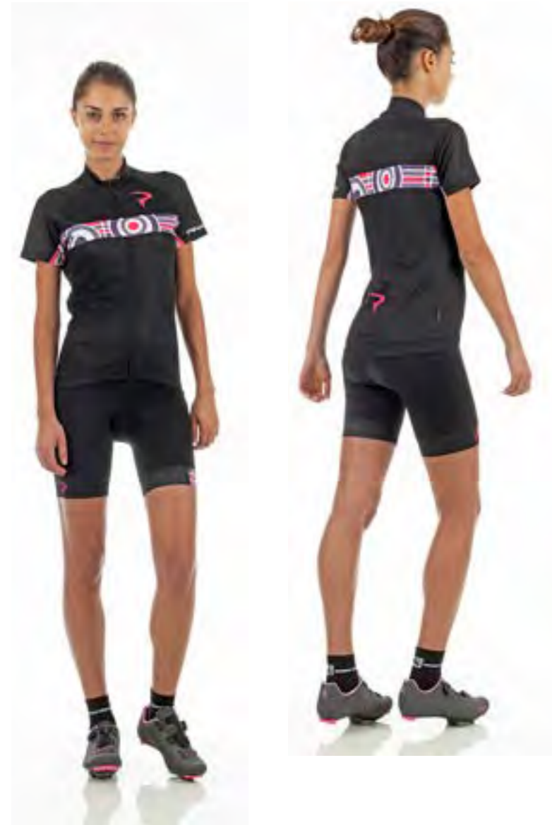
MAILLOT NEGRO - VIOLETA